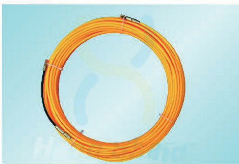
NY4005 - NY4030