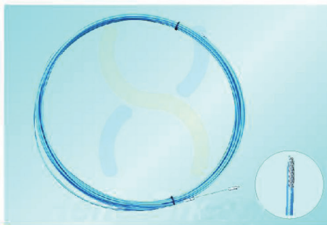
BM4005 - BM4030