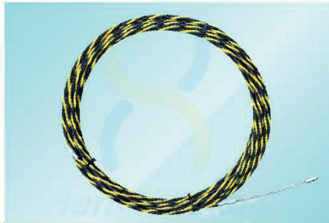
JDPY6015 - PY6060