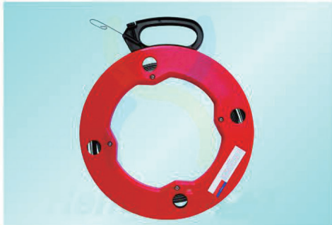
FB1330 - FB1360