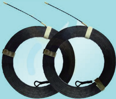
M5005B - M5030B