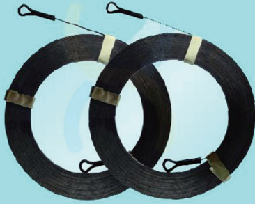
M5005A - M5030A