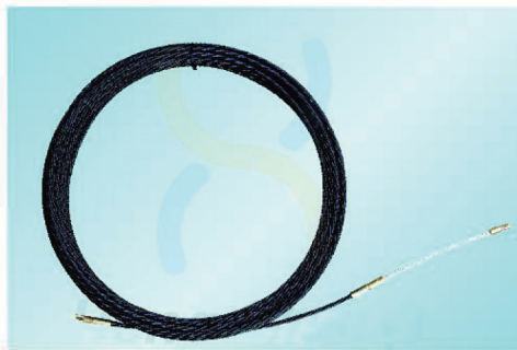
3PB6015 - 3PB6060