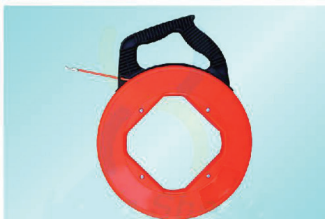
F-SR8030 - F-SR8075