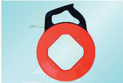
F-SM8030 - F-SM80100