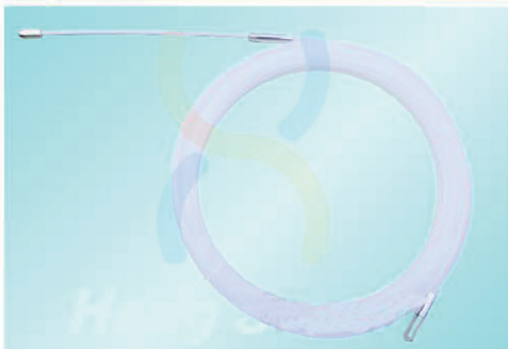
NZ4005 - NZ4030