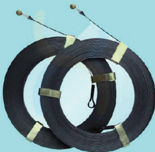
M5005C - M5030C