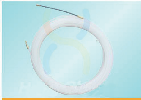
JDNL3005 - NL3030