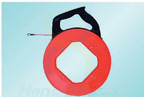
JDFL8030 - FL8075