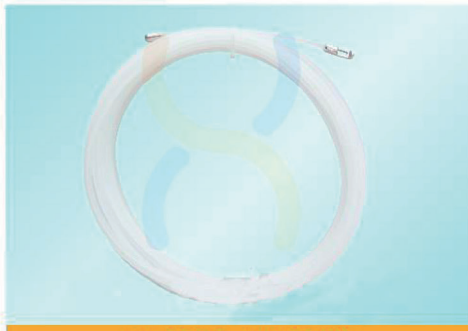
NL3005 - NL3030