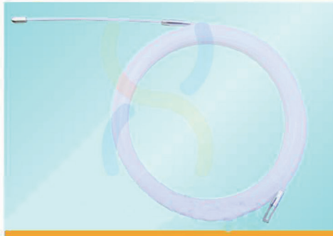
NZ3005 - NZ3030