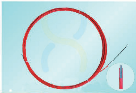
SR4005 - SR4030