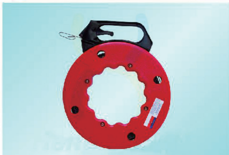
FS1310 - FS1330