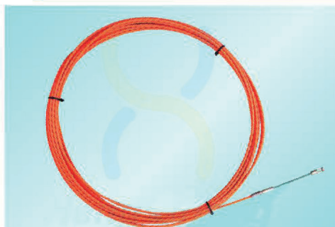
3PO4005 - 3PO4030