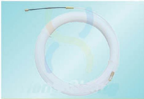
JDNL4005 - NL4030